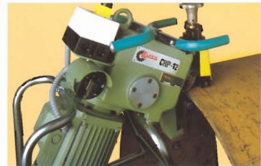
Ejemplo de chaflanado de piezas pequeñas multiformes. Examples of beveling multi-form little parts. Exemples de chanfreinage de petites pieces multiformes.